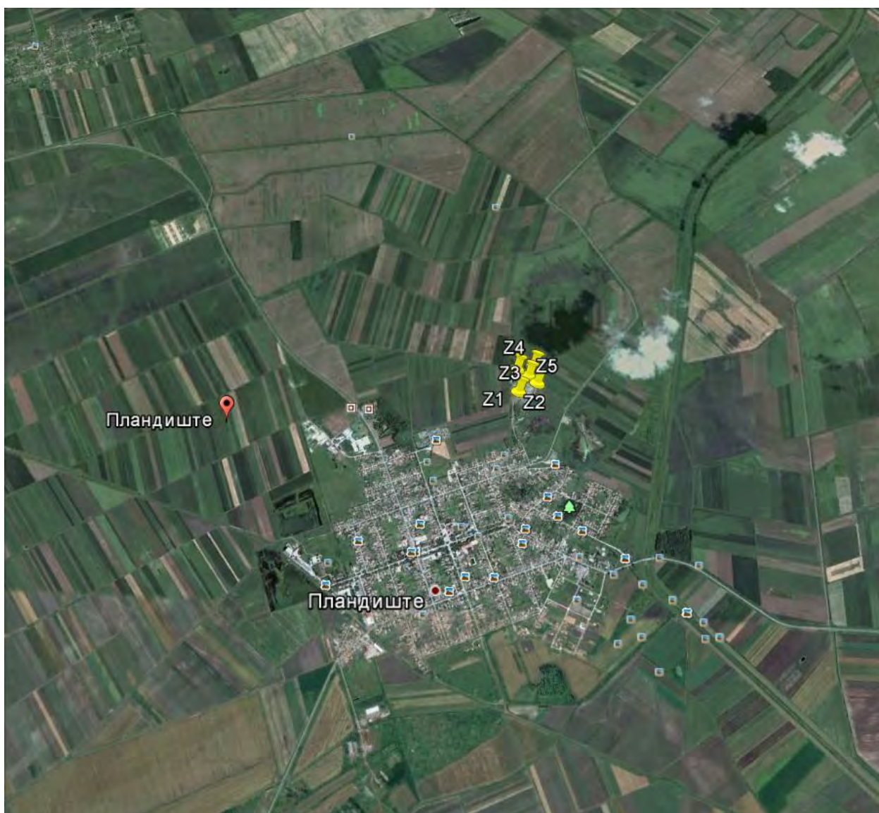
Слика 1. Приказ макролокације

Макролокацијски гледано испитивано подручје се налази на око 1 км од центра насељеног места Планиште.