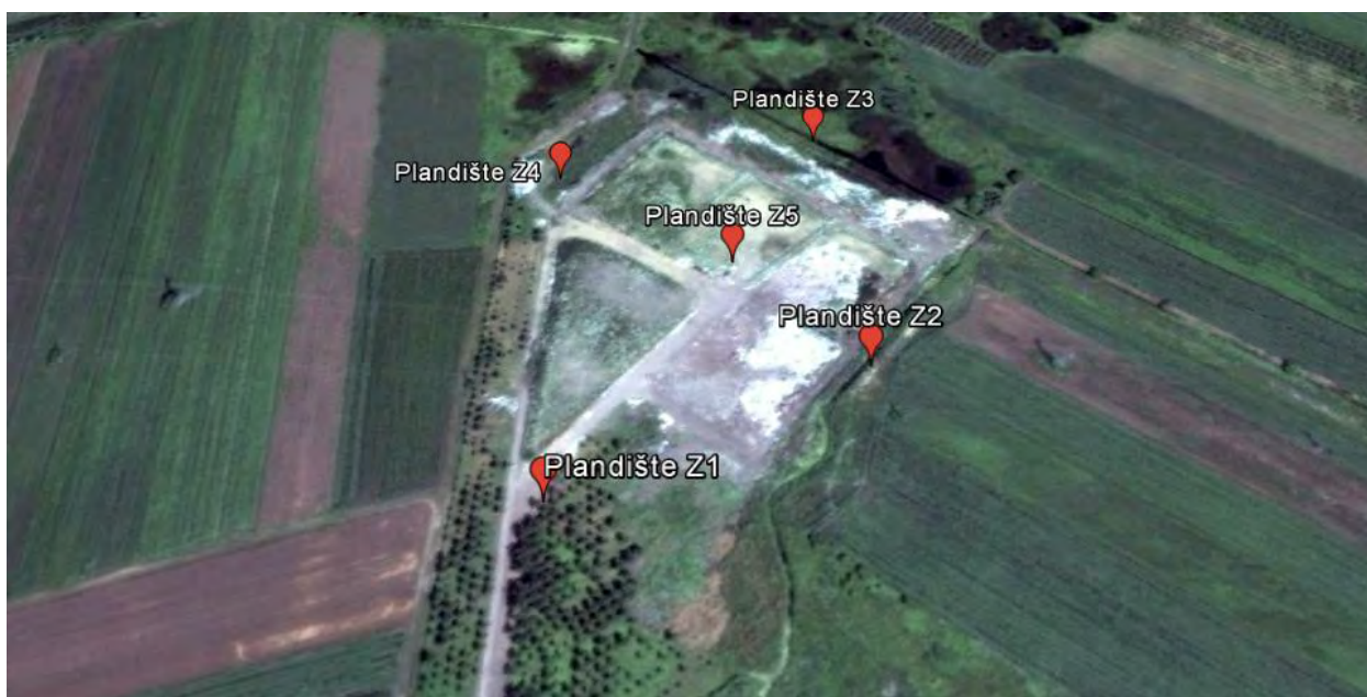
Слика 2. Приказ микролокације

Земљиште је узорковано са мерних места приказаним на слици 2., у чијој се близини налазе обрадиве површине.