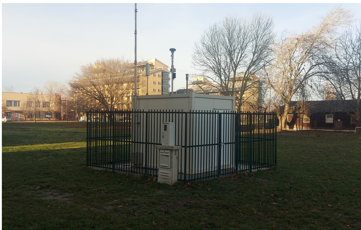
Mikrolokacija merne stanice „NOVI SAD“