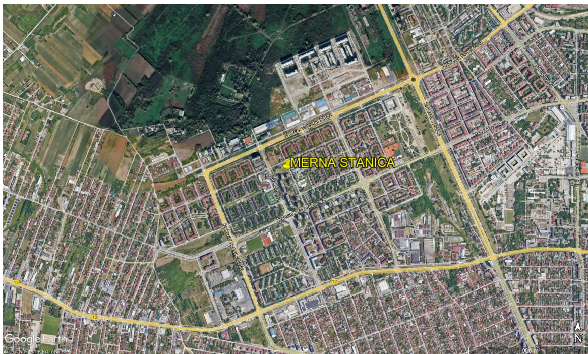
Makrolokacija merne stanice „NOVI SAD“