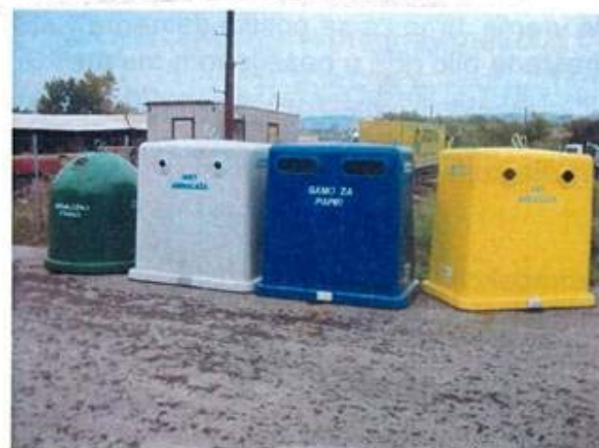
сепаратно одвајање пластике, папира, стакла