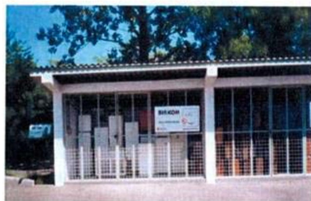
простор за фрижидере, телевизоре итд.