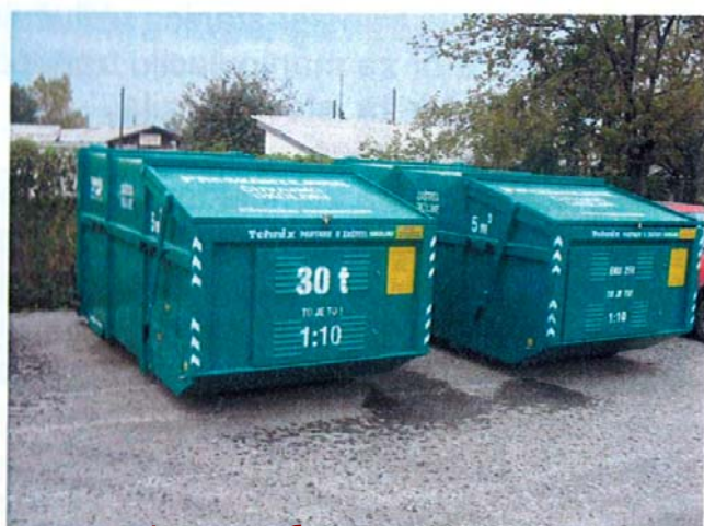
постројења за балирање папира