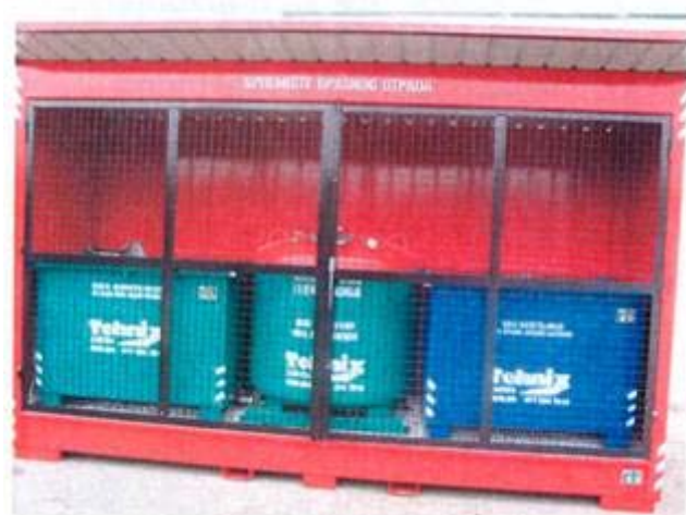
одвајање истрошеног моторног уља и акумулатора